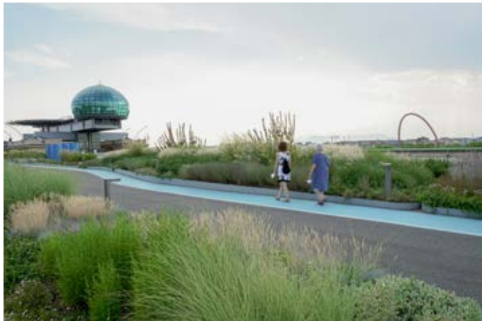
Lingotto, giardino pensile

Avviato nel 2023 nel quadro del programma Horizon Europe, il progetto intende testare approcci innovativi di pianificazione urbana che possano condurre le città verso il raggiungimento della neutralità climatica entro il 2050. Il progetto vuole superare i metodi tradizionali, valorizzando l'importanza dei dati e applicando sistemi di appalti pubblici innovativi . All'interno di questa cornice, Torino avvia due azioni pilota nell'ambito dei rifiuti e dell'economia circolare, testando nuove tipologie di servizi in maniera collaborativa.