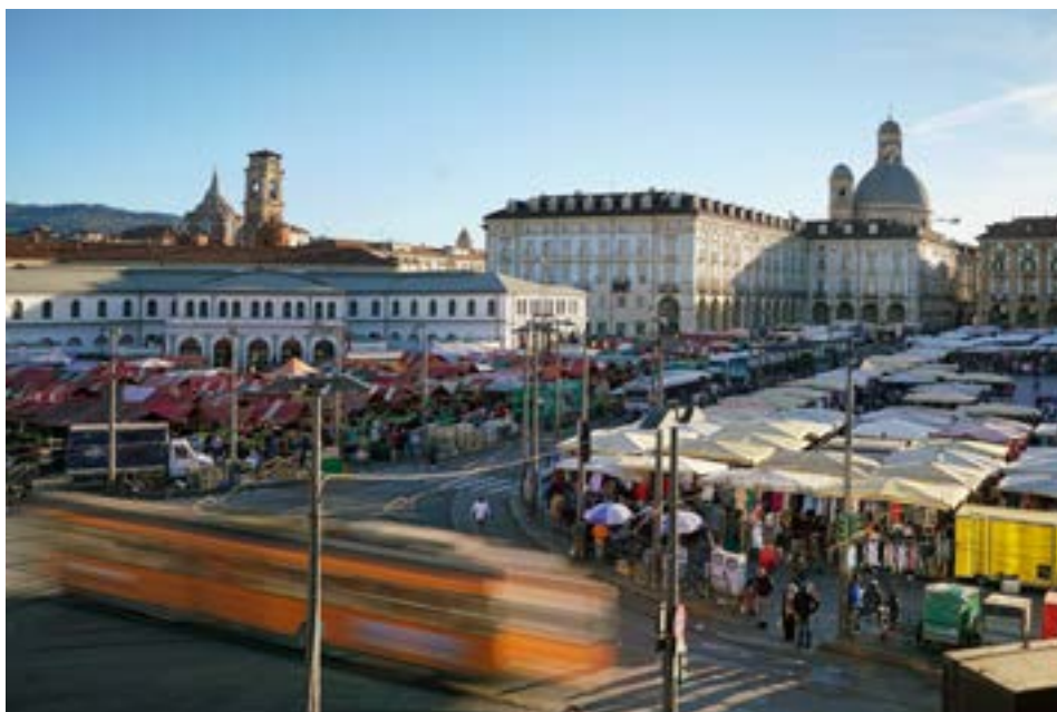
Mercato di Porta Palazzo

Nata nell'ambito di un Progetto Pilota Urbano avviato nel 1996, l'agenzia di sviluppo locale The Gate diventa uno strumento operativo della Città di Torino nel 2002. Si occupa di promuovere nuovi interventi di sviluppo economico, fisico e sociale sul territorio del quartiere di Porta Palazzo. Nel tempo ha supportato progetti per la riduzione del degrado abitativo, il ridisegno delle aree urbane con servizi più efficienti, la valorizzazione del patrimonio storico ma anche commerciale dell'area, la nascita di nuove opportunità economiche e l'avvio di processi di promozione e sviluppo del territorio.