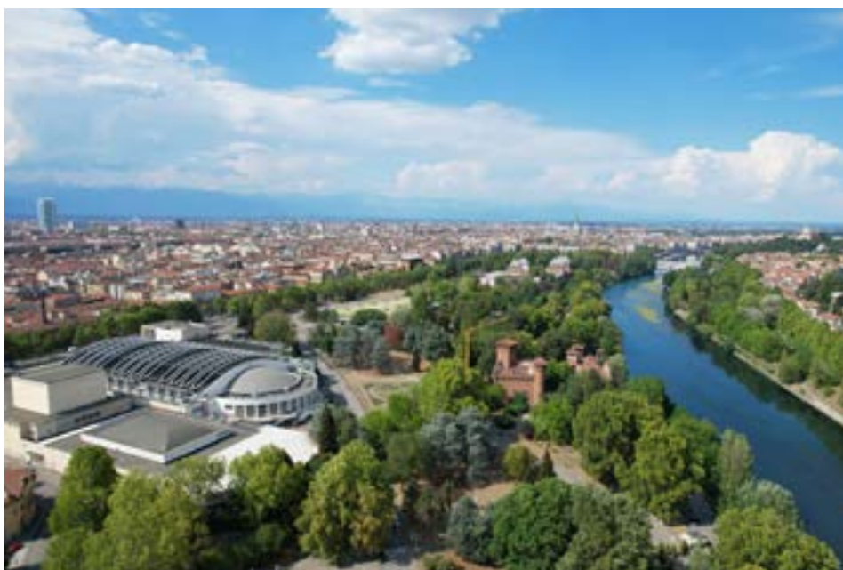
Parco del Valentino e Torino Esposizioni

Culture, accessibilità, inclusione, partecipazione. Sono queste le parole chiave di PIÙ , il Piano Integrato Urbano della Città di Torino che investe oltre 113 milioni di euro del PNRR. Il PIÙ intende affrontare il tema della rigenerazione urbana a partire dal sistema bibliotecario cittadino come elemento dell'infrastruttura sociale urbana . Le azioni prefigurano interventi sulle sedi di 19 biblioteche di quartiere e sul tessuto urbano che le ospita, agendo sulle vulnerabilità materiali e sociali, sull'eliminazione delle barriere fisiche e socio-culturali, sulla qualità dello spazio pubblico e sui luoghi della socialità e dell'inclusione.