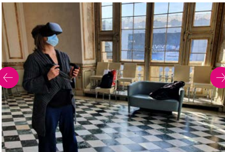
5GTOURS - Palazzo Madama

Grazie al supporto del programma Horizon 2020, Torino ha potuto mettere in campo 10 casi d'uso in collaborazione con la Fondazione Torino Musei e RAI - Radiotelevisione Italiana, per sperimentare l'uso della tecnologia 5G al servizio del settore turistico e culturale . Coinvolgendo centinaia di utenti, sono state create esperienze innovative di fruizione del patrimonio artistico e culturale, ma anche di contenuti audiovisivi prodotti in diretta. Nel progetto si è poi dimostrato come l'uso della rete 5G possa portare importanti innovazioni anche in campo sanitario-ospedaliero e aeroportuale , evidenziando la trasversalità di questa tecnologia.