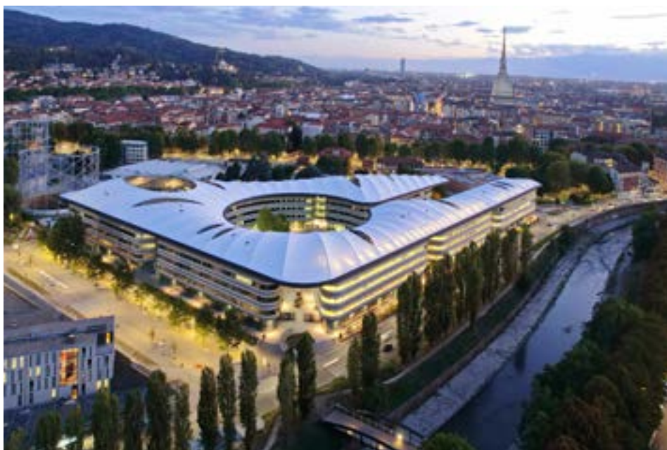
Campus Luigi Einaudi - Viale Mai

Il progetto ToNite , finanziato dal programma Urban Innovative Actions sul tema Urban Security, affronta i temi della sicurezza urbana e della vivibilità anche nelle ore notturne degli spazi pubblici lungo il fiume Dora. L'approccio inclusivo che caratterizza il progetto pone al centro le comunità locali e le potenzialità del territorio, inquadrando il tema della sicurezza in un' ottica d'innovazione sociale e rigenerazione urbana . Dentro a questa cornice si colloca la riqualificazione di viale Mai in una nuova area pedonale attrezzata di circa 4.500 mq. Grazie a un accordo tra Città e Università degli Studi di Torino, gli interventi fisici sono stati integrati con l'estensione anche nelle ore serali di alcuni servizi universitari, tra cui l'apertura delle aule studio, per permettere una più ampia fruizione del campus.